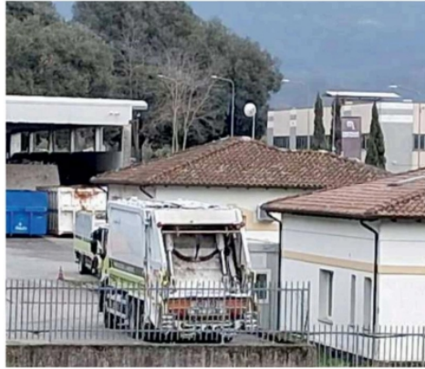
La sede di Bocca di Lunigiana Ambiente

Cosa c'è da sapere La selezione - anzi, le selezioni, dato che i profili ricercati sono due - è finalizzata alla messa a punto di graduatorie «senza obbligo di assunzione», si legge nei bandi. Significa che bisognerà avere un po' di pazienza, ma è parere diffuso