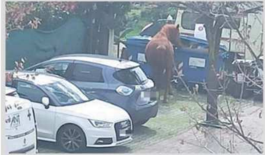
Qui sopra un cavallo nel parcheggio del condominio a Turano