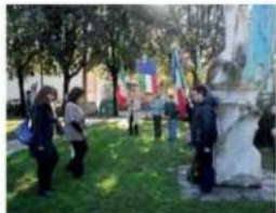
Una cerimonia di commemorazione al Parco del Partigiano di Avenza dove si è svolta anche quella per l'80°

pa, membro del Comitato Dal monti al mare con Avenza Sir-esiste. La cerimonia per l'80° Anniversario della Liberazione si è svolta al Parco del Partigiano. «Peccato che il contesto - interviene Della Zoppa - ha rovinato questo appuntamento: chi c'era si è trovato in un parco con delle giostre chiosose, che almeno per l'80° Anniversario potevano essere messe altrove. C'erano poi dei raglianti asinelli, di fronte alla fatiscente Sala Amendola e nemmeno per l'occasione si è provvedu-