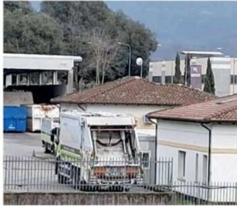
La sede di Boceda di Lunigiana Ambiente

Cosa c'è da sapere La selezione - anzi, le selezioni, dato che i profili ricercati sono due - è finalizzata alla messa a punto di graduatorie «senza obbligo di assunzione», si legge nei bandi. Significa che bisognerà avere un po' di pazienza, ma è parere diffuso