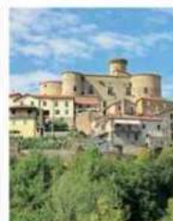
Il castello di Bastia e Licciana, uno dei tanti gioielli che brilla incastonato nella terra lunigianese

Un workshop e un local trip daranno la possibilità di